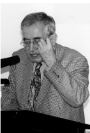
محەمەد ئەمین پینجوتنی

پ: ئەرکەکانتان؟ و: کۆکردنەووهی دەستنووس و سەرگوزشتە بەنرخە میلیییەکانی سەر زمانی خەلکی و نووسینەووهیان به نامییری نوێ، پتەیانندی مامۆستای زمانی کوردی، کۆمەککردن بهو بێگانە و تورکە چەپانەیی گەرەکیانە ئاوریکی له کورد و کێشەکەیی بدەنەووه. پ: ترس لای ئێوه مانای هیه؟ زەردەمخەنەیهک گرتی و وتی: ئێمە له باکووردا (۲۰) ملیۆنێن دەبیت لەناو ئەم بیست ملیۆنەدا چەند کەسانیک هەبن ئامادەیی قوربانی بن، ئێمە لەوانەین. له کاتی پشووواندا به هەلمان زانی چاویکەوتنیک لهگەڵ بەرپز (محەمەد ئەمین پینجوتنی)ی شاعیر و سەرۆکی ئەنستیتوتی کوردی له بەرلین بکەین: