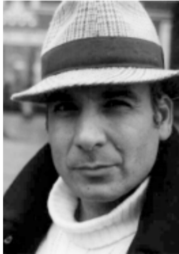
هونەرماند میران شه‌وکه‌ت

فیستیڤالی (الشاشه العربیه المستقله) بۆنەیکێ گەڕههه بۆ ئەو کەسانە لە بۆاری فیلمی تەسجیلی و فیلمی کێرانهوهی کورتدا به کاری سینەماوه خەریکن. لەم دواپیاندا دهوری دوومی ئەم فیستیڤالە له (الدوحه) له میرنشین (قطر) و له ژێر چاودێری و پێنمایی کەتالی ئاسمانی (الجزیره)دا بەرپۆهجوو و نەک تەنیا بەشیک له سینەماییهکانی عەرەب، بەلکوو بەشیکێ زۆریش له کەسانە له بریتانیا، فرەنسا، ئێران و دەرلهتانی تردا به کاری سینەماوه خەریکن تێیدا بەشدار بوون. پرووی بەرچاوی ئەم فیستیڤالە ئەوه بوو که به جێدهستنی لاوان و تازەپێگەیشتونانی بۆاری سینەمای پێوه دیار بوو و کۆمه‌لیک بەرههه می نوێی ئەو هونەرمانە تێدا پێشان درا که به پلهیکه بالا سوودیان له تەکنۆلۆژیای نوێی وینەگرتن و دەرتهنانی تایبەت وەرگرتوو، به شپۆههیک که بهشیک له دەرتهناران و ئەو کەسانەش که به کاری فیلمدروستکردنهوه خەریکن و بەشداریی فیستیڤالەکه‌یان کردبوو، خۆپێنیا له ولاتانی رۆژئاوا له بۆاری سینەمادا تەواو کردوو و هەندیکیان، تا ئێستاش، له رۆژئاوا دا دەرژین و هەر لهوێش به کاری سینەماوه خەریکن. لەبەر ئەم هۆیه‌ش کێهه‌ریکی توند، له کاتی پێشبرکێی فیستیڤالەکه‌دا و بۆ بەدهستته‌ینان و بردنه‌وهی خەلاته‌کان، له‌تیو به‌شداربووانا هه‌بوو. له‌تیواره‌ی کۆتاییه‌ینانی فیستیڤالەکه‌دا چەند هونەرماندیکێ خەلکی فەلستین، تونس، میسر و