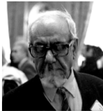
مامۆستا هه ژاری موکریانی