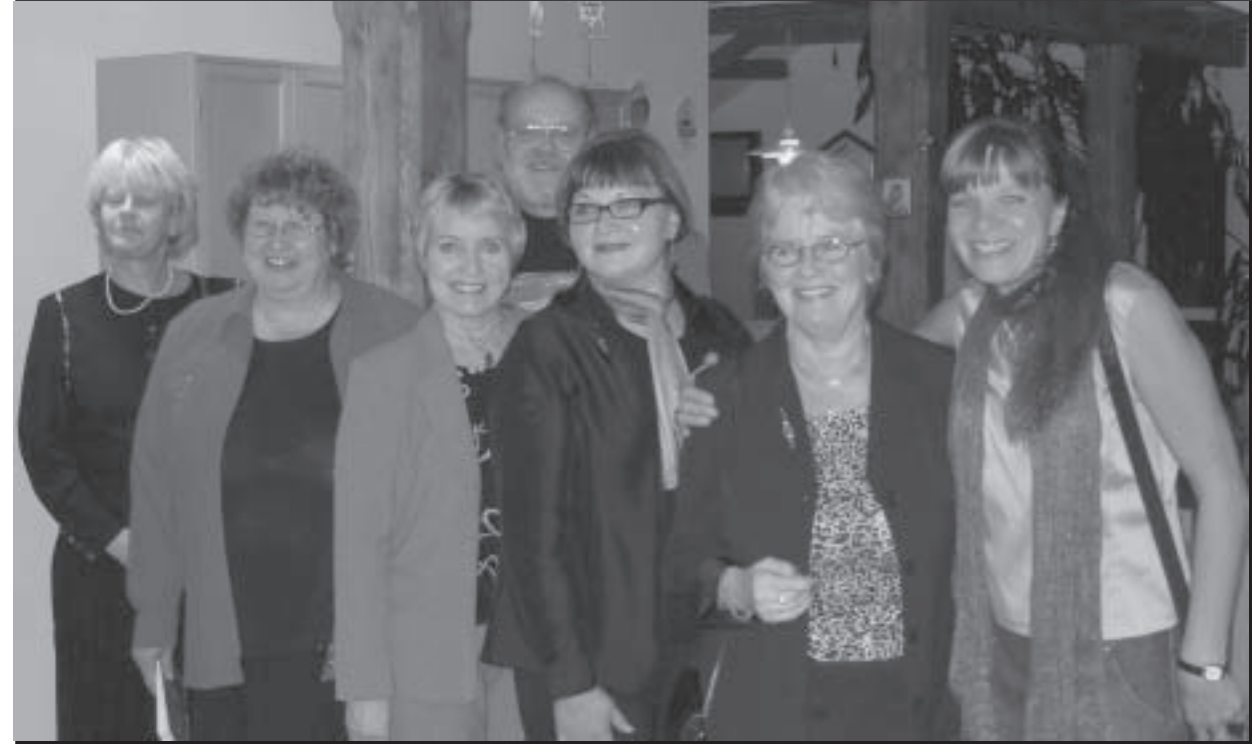
RSO:n Eskilstunan osasto täytti 30 vuotta ss. 8-9

RSO SFIL 32. vuosi RUOTSIN SUOMALAINEN OPETTAJALIITTO 5-6-2003 SVERIGES FINSKA LÄRARFÖRBUND